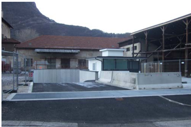
L'ingresso del parcheggio interrato

Dopo lunghe vicissitudini burocratiche ed economiche, siamo finalmente riusciti a consegnare i garage ai soci della cooperativa „Parkauto Dolomiti“.