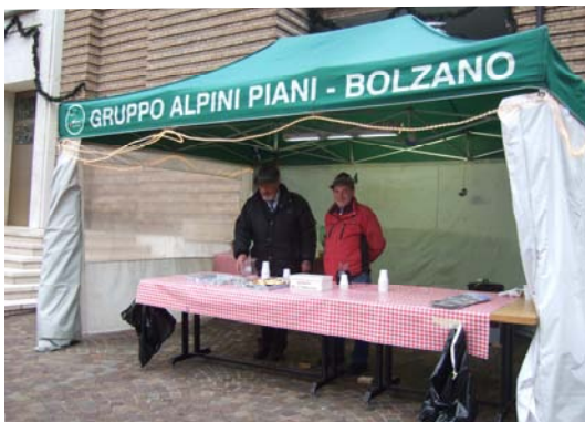
La tenda della solidarietà