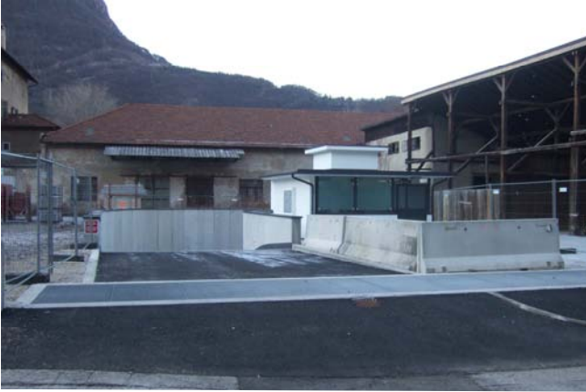
L'ingresso del parcheggio interrato

Dopo lunghe vicissitudini burocratiche ed economiche, siamo finalmente riusciti a consegnare i garage ai soci della cooperativa „Parkauto Dolomiti“.